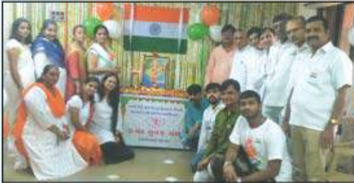
ડોંબીવલી શાખા દ્વારા ભારતમાતા પૂજન કાર્યક્રમમાં દાતાશ્રીઓ અને શાખાના કાર્યકર્તાઓ દ્વારા સંપન્ન થયો.