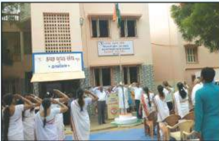
માતુશ્રી ઉમરનાઈ લાલજી એન્કરવાલા સરસ્વતી વિદ્યામંદીર (ભુજ) ખાતે ધ્વજ વંદન અને ભારતમાતા પૂજનનો કાર્યક્રમ - શિક્ષકો અને વિદ્યાર્થીઓ હાજર રહ્યાં હતા.