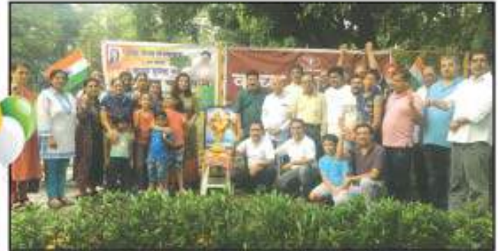
નવી મુંબઈ (વાશી) શાખા દ્વારા ભારતમાતા પૂજન તથા વૃદ્ધારોપણ કાર્યક્રમ કાર્યકર્તાઓ દ્વારા સંપન્ન થયો.